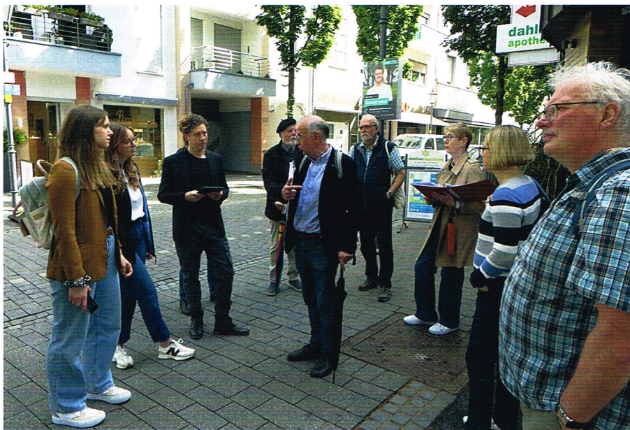
Was sehen wir, was sehen wir nicht mehr? Zwei Kommunen, die Uni Koblenz und der Denkmalverein Sinzig zur Besichtigung in Bad Neuenahr.

Zu sehen sind noch Eingangsbereich, Lesesaal und Kurmittelhaus – alles andere in der Bodendorfer Kurgeschichte wartet darauf, wieder sichtbar zu werden.