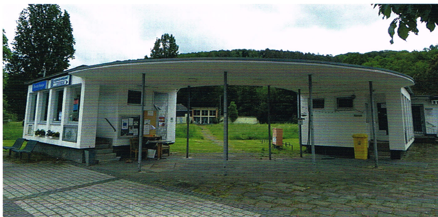
Nur noch Spuren des früheren Kurbetriebs sind im Sinziger Stadtteil Bad Bodendorf erkennbar.